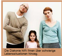
Die Diakonie hilft Ihnen über schwierige Lebenssituationen hinweg.

Dafür stehen hauptamtliche Fachkräfte und ehrenamtliche Helferinnen und Helfer zur Verfügung. Ihnen können Sie sich anvertrauen. Sie verfügen nicht nur über das notwendige Fachwissen, sondern nehmen sich auch Zeit für Sie und Ihre Probleme. Alle Mitarbeiterinnen und Mitarbeiter der Diakonie sind außerdem zu Verschwiegenheit und Vertraulichkeit verpflichtet.